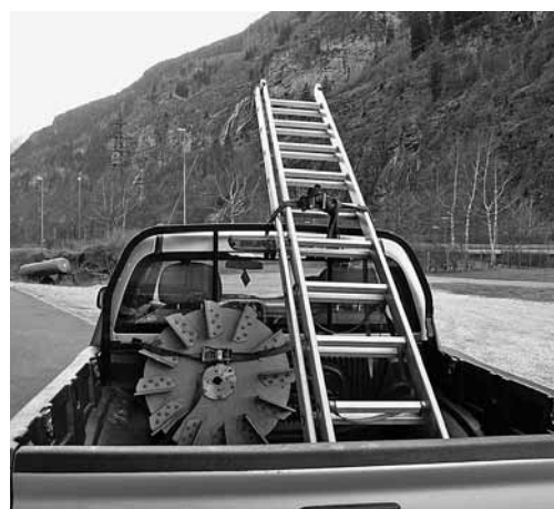
Figura 2: fissaggio del carico sul veicolo.