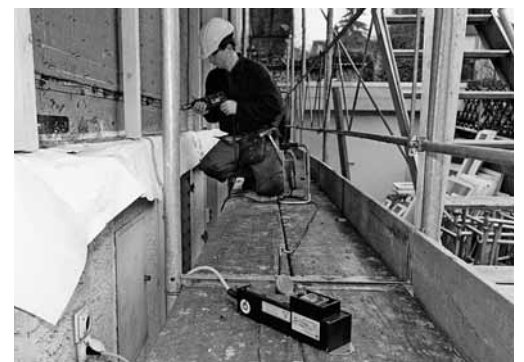
Figura 5: in mancanza di un distributore di corrente per cantieri utilizzare l'interruttore FI (salvavita).

Prima di iniziare i lavori, i collaboratori si informano presso il cliente sull'ubicazione delle seguenti strutture di emergenza?