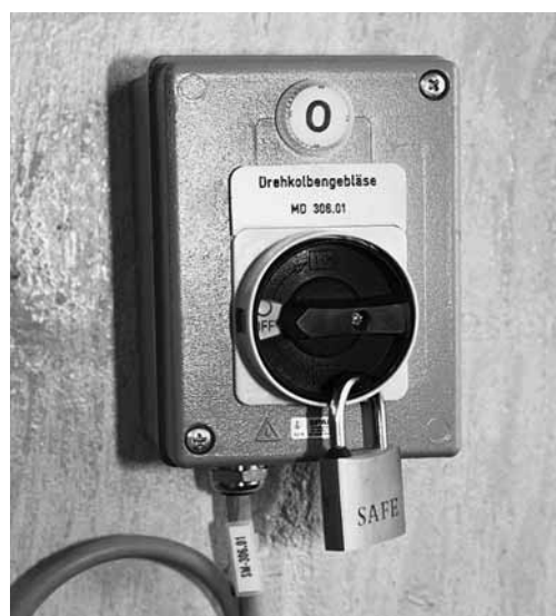
Figura 3: interruttore di sicurezza in posizione 0, bloccato con un lucchetto contro il reinserimento.